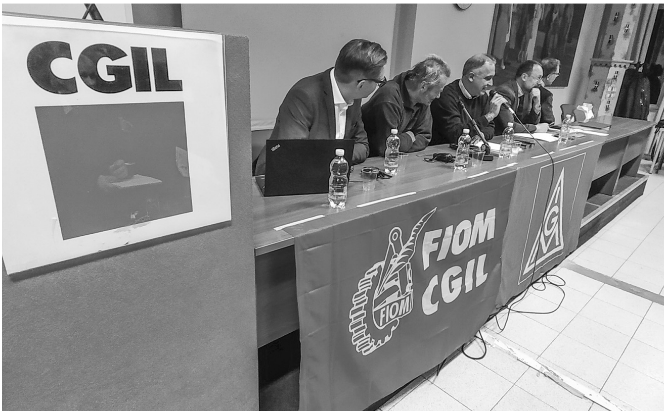
Genova, 19 novembre 2019. Una riunione della Cooperazione Ingegneri e Tecnici

In the public sector, the municipalities and the union of the services sector, ver.di, have agreed on an integration that guarantees 90% of the net salary and 95% as regards low and medium salaries. Also from the point of view of the economic trend, the Kurzarbeit proves to be a fundamental tool in the crisis. As some studies show, the impact on the economy would be much greater without the Kurzarbeit tool. It is in fact the safeguarding of jobs that manages to curb the recession.